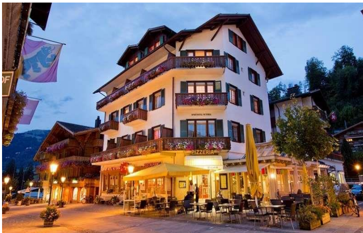
Unser Hotel in Gstaad.

Damit wir die Hotelzimmer reservieren können, brauchen wir von euch eine Anmeldung. Man telefoniere oder maile sobald wie möglich, spätestens aber bis am 19. August. Das Anmeldeformular findet ihr im Anhang.